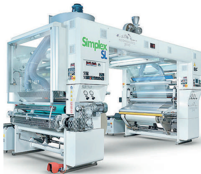
Una delle macchine prodotte da Nordmeccanica; sopra: lo stabilimento